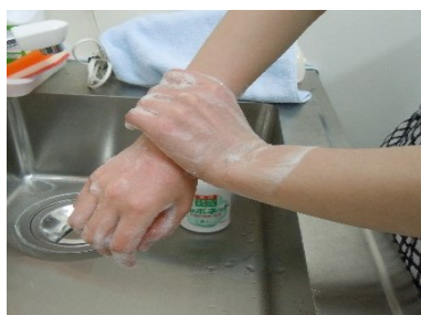
⑧ 手首もクルクル洗う