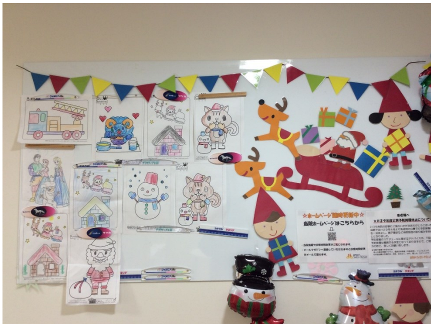
診察室前のボードも クリスマス仕様

また、皆さんから描いてもらった絵も飾っています！待合室にぬり絵セットを置いているので待ち時間にぜひ、絵を塗って終わったら看護師さんに渡してくださいね！