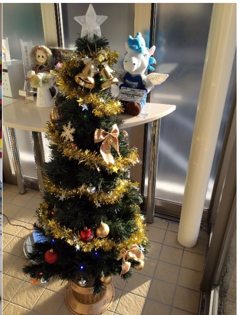
ライトアップ もするよ