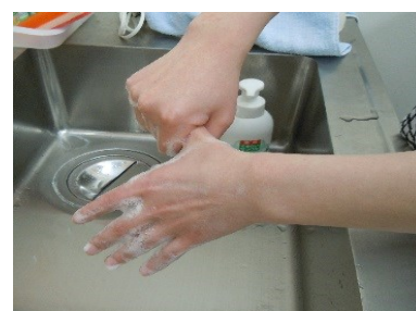
⑦ 親指をクルクル洗う