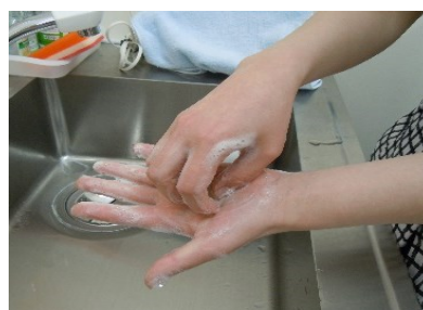
⑥ 指先、爪の間を洗う