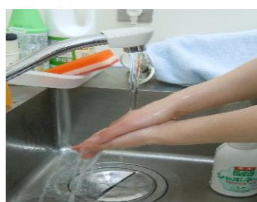
⑨ 流水でしっかりすすぐ